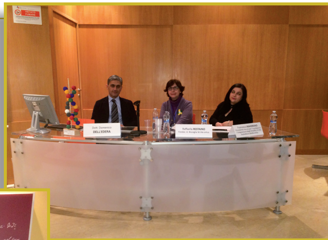
MATERA — Momenti del Convegno.

Le conclusioni condivise dell'evento ben si sposano con lo slogan di quest'anno "Show