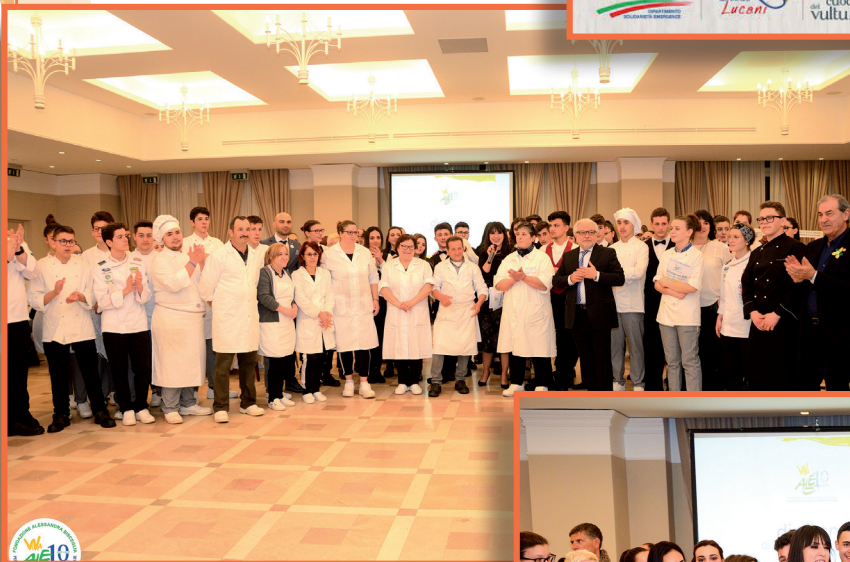
MELFI — Lo Staff per l'evento.

nei tanti ospiti intervenuti alla serata, per l’originalità del percorso e la bravura dei giovani studenti coinvolti.