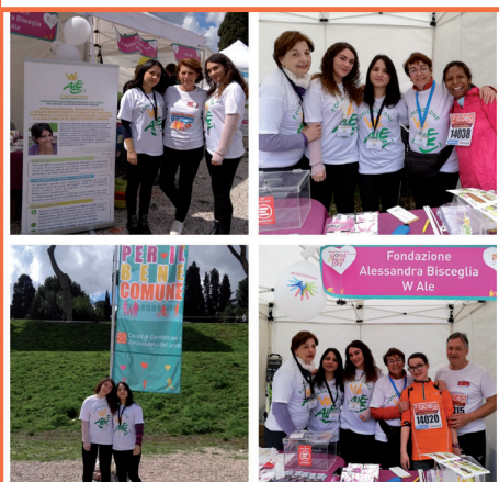
ROMA — Volontari al gazebo.

Tantissime le Associazioni che all'interno del Circo Massimo, con i gazebo allestiti per l'occasione, hanno dato vita ad una giornata di intrattenimento, ma anche di sensibilizzazione e solidarietà. Anche la Fondazione Alessandra Bisceglia W Ale Onlus ha partecipato, con il proprio stand e i propri volontari, a una grande festa che ha interessato tutta la città.