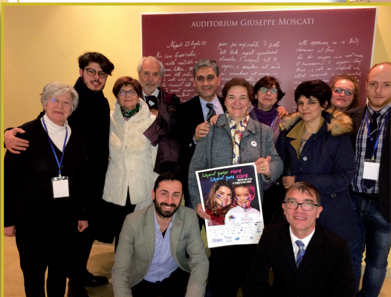
MATERA — Gruppo rappresentanti delle Associazioni organizzatrici.

Si è tenuto il 23 febbraio 2019, presso la Lega del Filo d'Oro di Molfetta, un meeting dal titolo: " Le malattie rare: aspetti etici, sanitari e