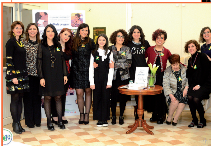
MELFI — Volontari e Collaboratori della Fondazione.

Tutor d'aula e responsabile del progetto