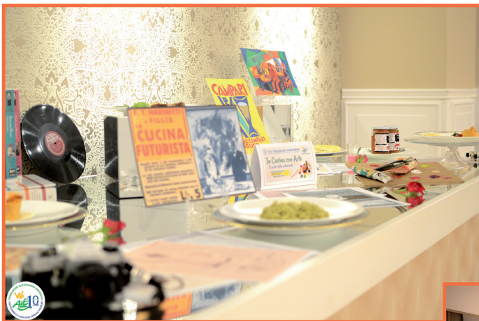
MELFI — Allestimento che descrive il progetto.