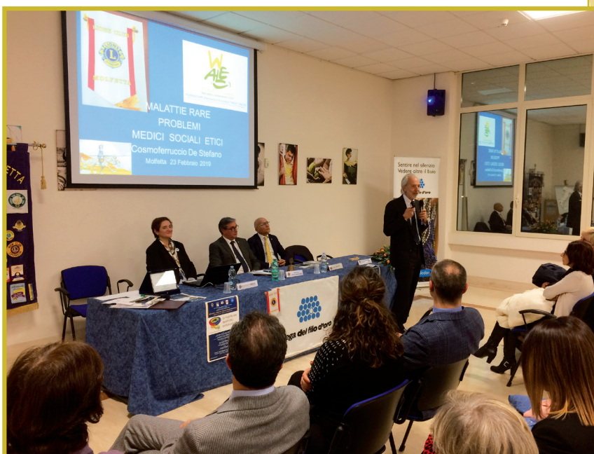
MOLFETTA — Momenti del Convegno.

za, focalizzando l'attenzione sull'organizzazione della rete dei Presidi, sul sistema di monitoraggio, sui problemi legati alla codifica delle malattie rare e alle banche dati, ma soprattutto