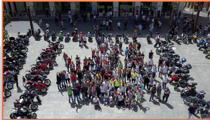
Momenti del Memorial.