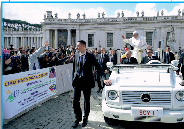
Lo striscione che rappresenta il nostro gruppo.

Dopo aver ascoltato con attenzione le Sue parole, che ci hanno raccontato del "viaggio del Vangelo nel mondo", i rappresentanti della Fondazione hanno potuto consegnare al Papa alcuni doni. Abbiamo messo nelle Sue mani il libro e il portachiavi rea-