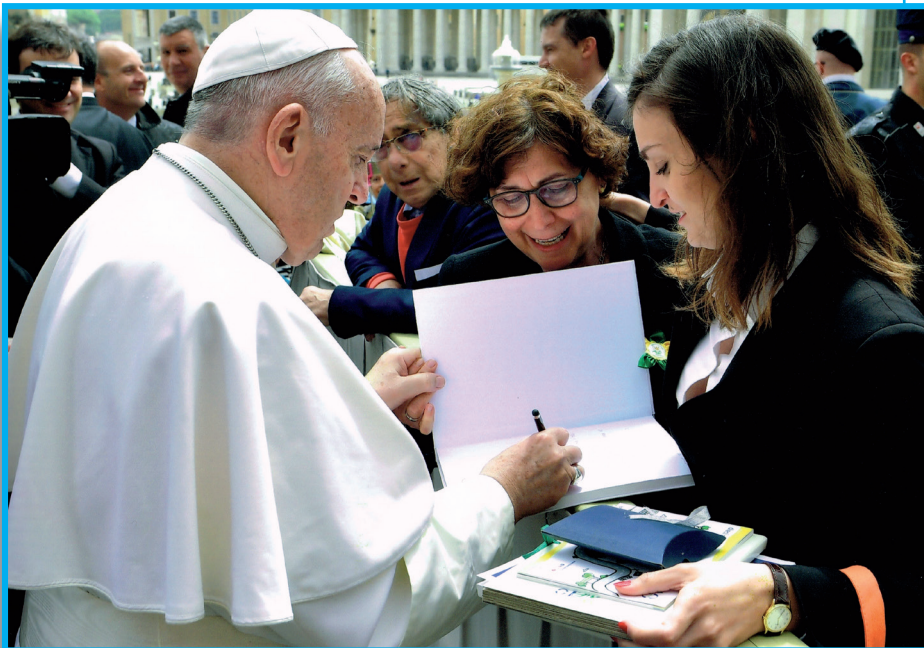
Il Santo Padre firma il libro dei 10 anni della Fondazione.

Dopo aver percorso più volte piazza San Pietro e aver riempito di sorrisi e saluti tutti i presenti, Francesco comincia la Sua udienza, e dal sagrato inizia a salutare le associazioni e gruppi presenti, così ecco arrivare il saluto alla nostra Fondazione, ecco che il Papa in persona nomina e ringrazia la