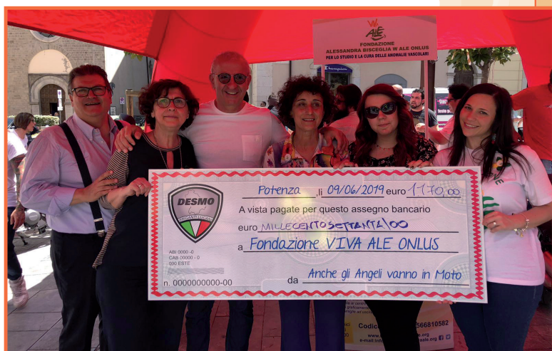
La Fondazione riceve assegno donazione.