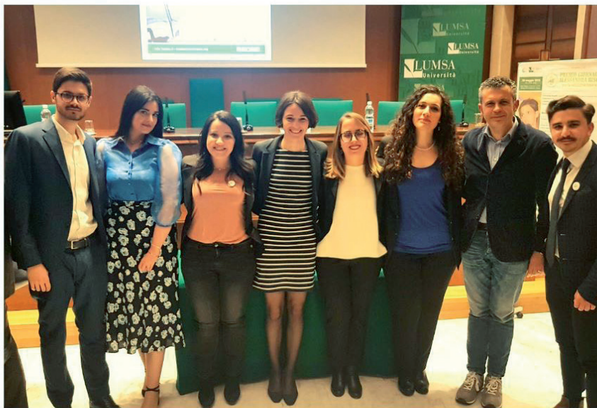
PREMIO GIORNALISTICO ALESSANDRA BISCEGLIA per la comunicazione sociale