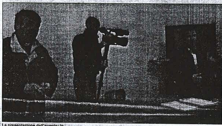
La presentazione dell'evento; in basso la chiesa di San Francesco

Normalmente - ha quindi aggiunto - per tale esercizio di pietà cristiana, in luogo aperto, si fa ricorso anche a semplici figuranti, non per fare dello spettacolo fine a se stesso, ma perché il messaggio religioso non venga rinforzato per giungere alla persona sorda, emarginata dalla forza della parola, e che, per sua natura, vive prevalentemente di immagini visive». Una prova impegnativa quella a cui la comunità dei sordi di Matera ha voluto sottoporsi, e che, giustamente, è stata indicata da Stigliano come un onere, che, però, al contempo, ha visto stringere attorno alle fasi organizzative dell'evento un mondo assai più vasto, fatto anche da chi non vive