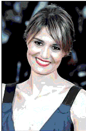
PROTAGONISTI Tra gli ospiti della rassegna Paola Cortellesi e Jeremy Irons

« C on 104 film in calendario tra il 1 giugno, domenica, e il 1° agosto nelle tre arene di piazza San Cosimato, del Casale della Cervelletta e del Porto Turistico di Ostia offriamo una grande biblioteca pubblica di cinema, gratuita e per una visione collettiva su grande schermo». Valerio Carrocci, presidente - e frontman - dell'associazione Piccolo Cinema America annuncia con orgoglio Il cinema in piazza , anno 2019, frutto di un intenso lavoro di mediazione con le istituzioni locali (e non solo). Il risultato è un programma di ottimi film del passato accompagnati da grandi ospiti, "che non sono in alcun modo in competizione con le sale e con le arene a pagamento, anzi sono un bel modo per riavvicinare il pubblico al grande schermo. Se non è giusto che il cinema sia gratuito, il Cinema America offre il biglietto agli spettatori grazie agli sponsor", specifica Carrocci. Dopo le polemiche scatenate negli scorsi mesi da esercenti e distributori