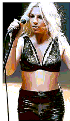
CANTANTE Emma Marrone

Consigliere di Parità della Provincia di Terni e il sostegno delle associazioni culturali Amelia Cioclopica, Civiltà Laica, Regoladarte, asd Athletic Lab Amelia e il sostegno delle associazioni Lgbt Omphalos, Famiglie Arcobaleno, Agedo Terni, Esedomani, Casa delle Donne Terni, Bossy. Il progetto ha raccolto anche il sostegno di attività commerciali, dal colosso finanziario PayPal a piccoli finanziatori.