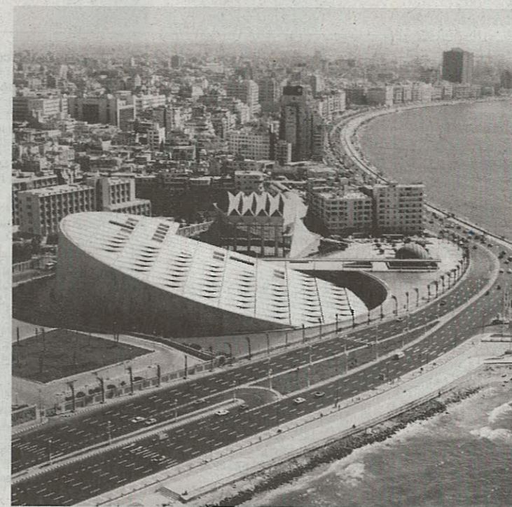
LUOGO DI MEDITAZIONE La nuova Biblioteca di Alessandria vista dall'esterno

Una superficie di 85 mila metri quadrati. Comprende anche due musei e una sala mostre