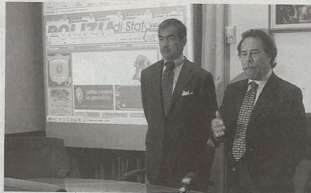
202 ARRESTI PER FURTO Ieri mattina, nel presentare l'operazione «Vie libere», il questore Nicola Cavaliere ha fornito dati in dettaglio. A Roma sono state arrestate 323 persone, 189 straniere. Soltanto nel centro, fermate 68 persone per spaccio. Gli arresti per reati contro il patrimonio sono stati 202 e 47 quelli per sfruttamento della prostituzione.