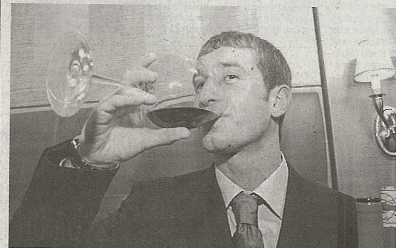
IL ROSSO DI JARNO TRULLI Non avrà la «rossa» di Maranello, ma va fiero del suo rosso, il Montepulciano doc Podere Castorani: Jarno Trulli, pilota in F1 con Renault, lo ha presentato ieri sera al Café Romano durante una serata dedicata agli abruzzesi (foto Guaitoli/Benvegna)