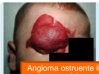
Angioma ostruente il campo visivo