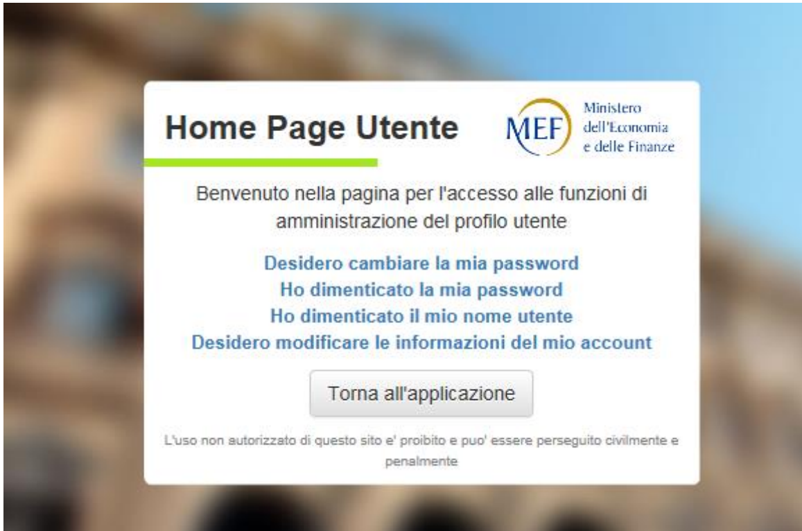
Figura 4: Amministrazione del profilo utente

Utilizzando il link “Reset Password” si accede alle funzioni di amministrazione del proprio profilo utente (figura 4).