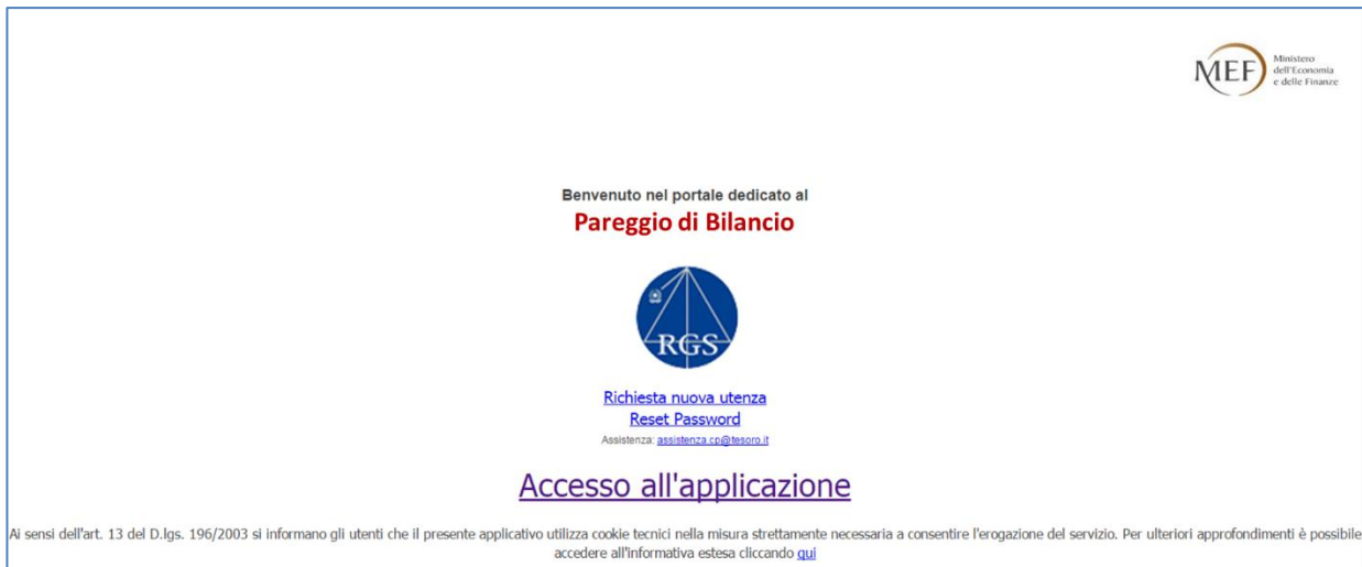
Figura 1: pagina iniziale

È necessario compilare il modulo di richiesta (figura 2).